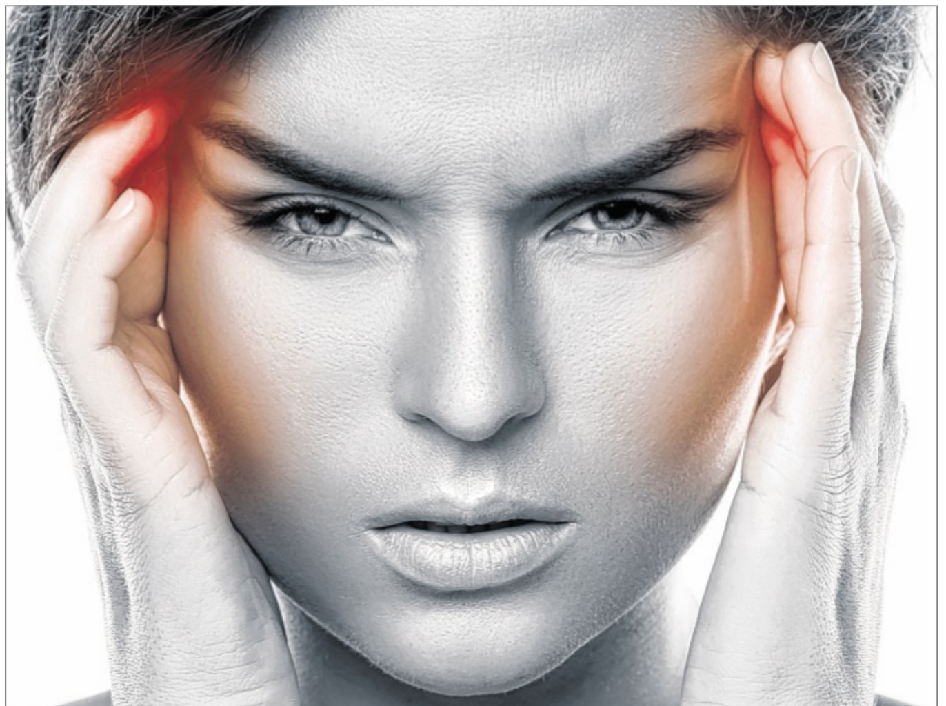
Gibt es einen Zusammenhang zwischen Wirbelgelenkstellungen und Kopfschmerzen? Eine Studie, für die bei der Physiotherapie Gough in Lahde mehrere Probanden gesucht werden, soll entscheidende Hinweise geben.

stätigt sein. In den Räumen der Praxis Gough in Lahde wird dann durch einen Tastbefund die Stellung der Halswirbelkörper ermittelt. Im zweiten Schritt wird die Bewegung der Kiefergelenke mit einem Axiografiegerät aufgezeichnet. Alle Daten werden ausschließlich anonymisiert ausgewertet und verwendet. Sie dienen dazu, eine Hypothese zu formulieren, nach der bestimmte Wir-